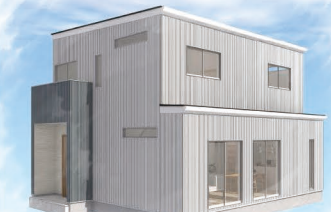
ハウスはイメージです。現物と異なる場合がございます。

●所在地 / 那須塩原市二つ室 ●地目 / 宅地 ●用途地域 / 無指定 ●建ぺい率 / 60% ●容積率 / 200% ●構造 / 木造2階建 ●築年月 / 2010年8月 ●上水道 / 公営 ●排水 / 公営 ●学校 / 大山小学校 ●取引態様 / 仲介